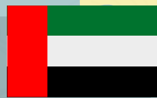
阿拉伯联合酋长国