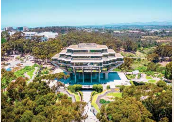
邻近圣地亚哥和洛杉矶的世界知名大学，包括