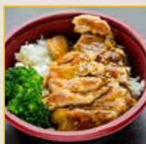
照烧鸡肉、椰子虾、肉丸和沙拉