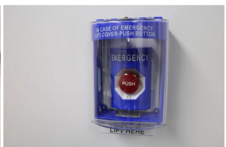
Hệ thống 1 nút khóa trong khuôn viên trường được nối mạng với các sở cảnh sát