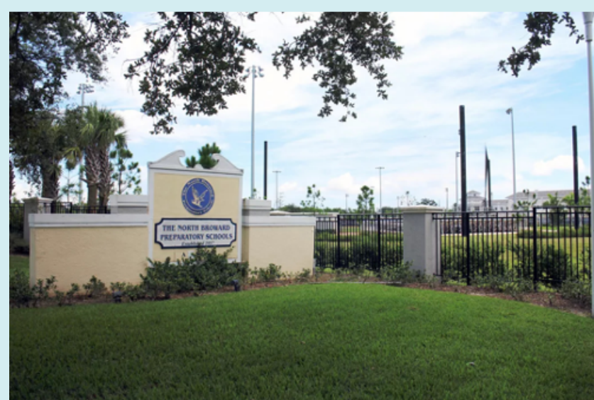
Khuôn viên trường được kiểm soát hoàn toàn để đảm bảo an toàn hơn