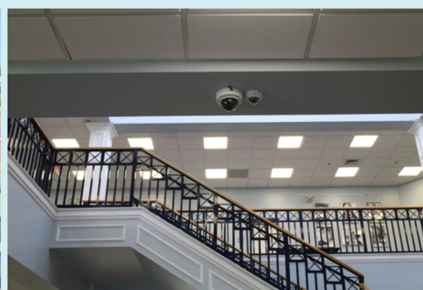
Hệ thống camera giám sát 24 giờ được phân phối trong khuôn viên