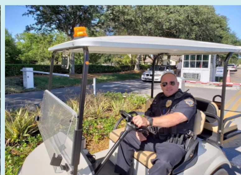
Nhân viên bảo vệ và cảnh sát vũ trang tuần tra khuôn viên trường 24 giờ một ngày