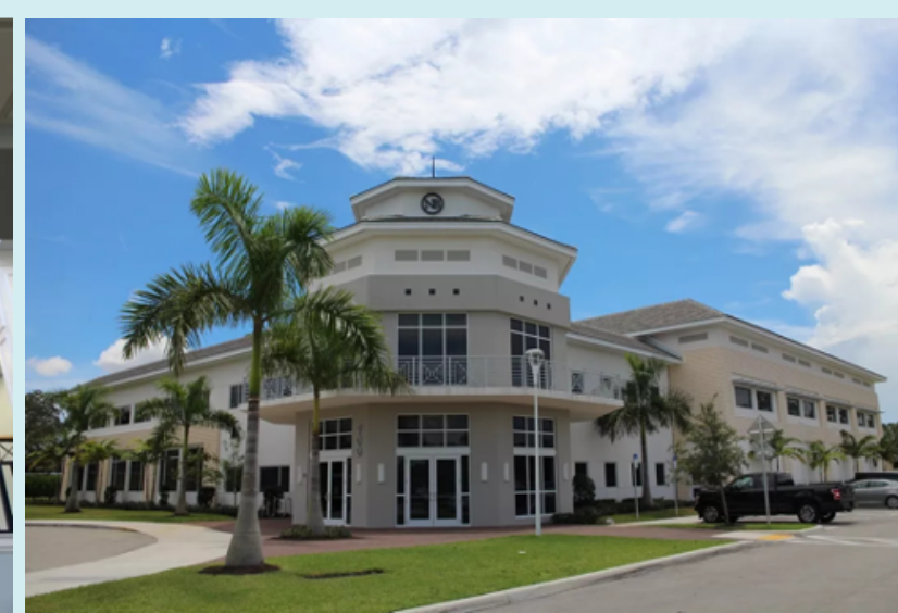
Tất cả các phòng học đều được lắp kính chống va đập