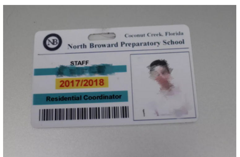
Sử dụng thẻ ID của khuôn viên trường để xác định quyền ra vào tòa nhà