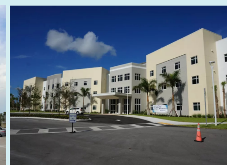
Ký túc xá trong khuôn viên trường đảm bảo an toàn hơn cho sinh viên