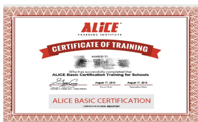
Giáo viên và học sinh tham gia khóa huấn luyện an toàn thường xuyên