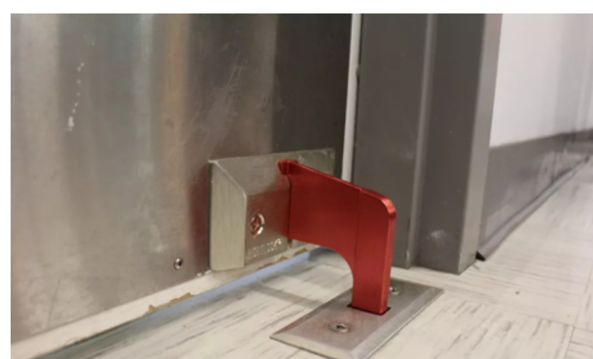
Mỗi phòng học được trang bị hệ thống chốt khóa