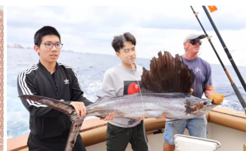
Các hoạt động cuối tuần và ngày nghỉ do nhà trường sắp xếp