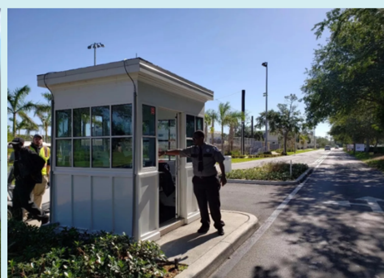
Có bảo vệ gác cổng trường ở lối vào và lối ra của khuôn viên trường suốt ngày đêm